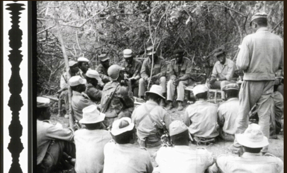
Frame do documentário "Venceremos", de 1967, filmado por Dragutin Popovic para a Frelimo. Cortesia Filmske novosti, Belgrado

O projeto “Jornais de Actualidades Não-alinhados” chega a Maputo!